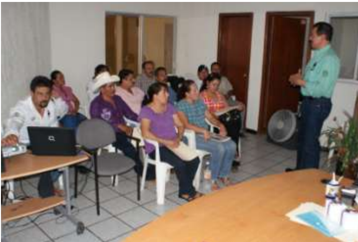
Coordinador Regional en Moris