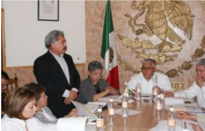
El Director General en Aldama